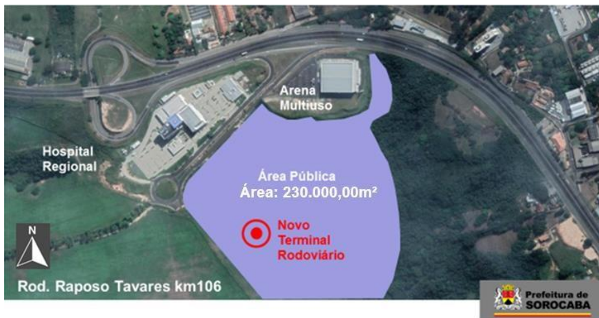
Imagem da área pública disponível

A ocupação do Novo Terminal Rodoviário de Sorocaba, deverá ser de até 20% dessa área, ficando 80% de área permeável.