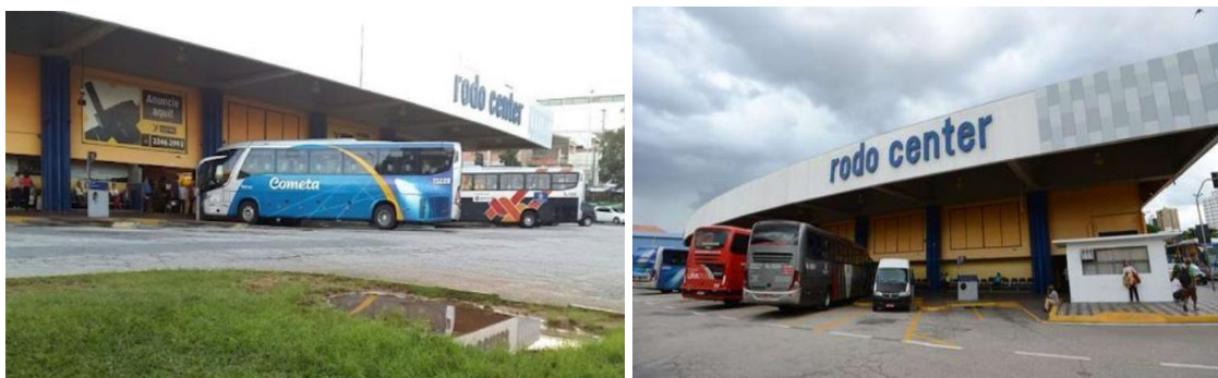
Imagens da Rodoviária Atual – 2021

Atualmente a infraestrutura da Rodoviária de Sorocaba remete as mesmas características originais da sua construção dos anos 1970, consideradas ultrapassadas e desatualizadas diante dos atuais padrões de mobilidade e integração dos sistemas de transportes. Outra questão relevante está relacionada com a sua localização na região central da cidade, situação considerada atualmente inadequada para os acessos, deslocamentos, estacionamentos. Outro fato agravante é o seu modelo construtivo totalmente aberto, que além de ultrapassado, proporciona ambiente favorável para atividades ilícitas e insegurança do local e do seu entorno