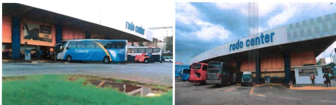
Imagens da Rodoviária Atual – 2021

Atualmente a infraestrutura da Rodoviária de Sorocaba remete as mesmas características originais da sua construção dos anos 1970, consideradas ultrapassadas e desatualizadas diante dos atuais padrões de mobilidade e integração dos sistemas de transportes. Outra questão relevante está relacionada com a sua localização na região central da cidade, situação considerada atualmente inadequada para os acessos, deslocamentos, estacionamentos. Outro fato agravante é o seu modelo construtivo totalmente aberto, que além de ultrapassado, proporciona ambiente favorável para atividades ilícitas e insegurança do local e do seu entorno