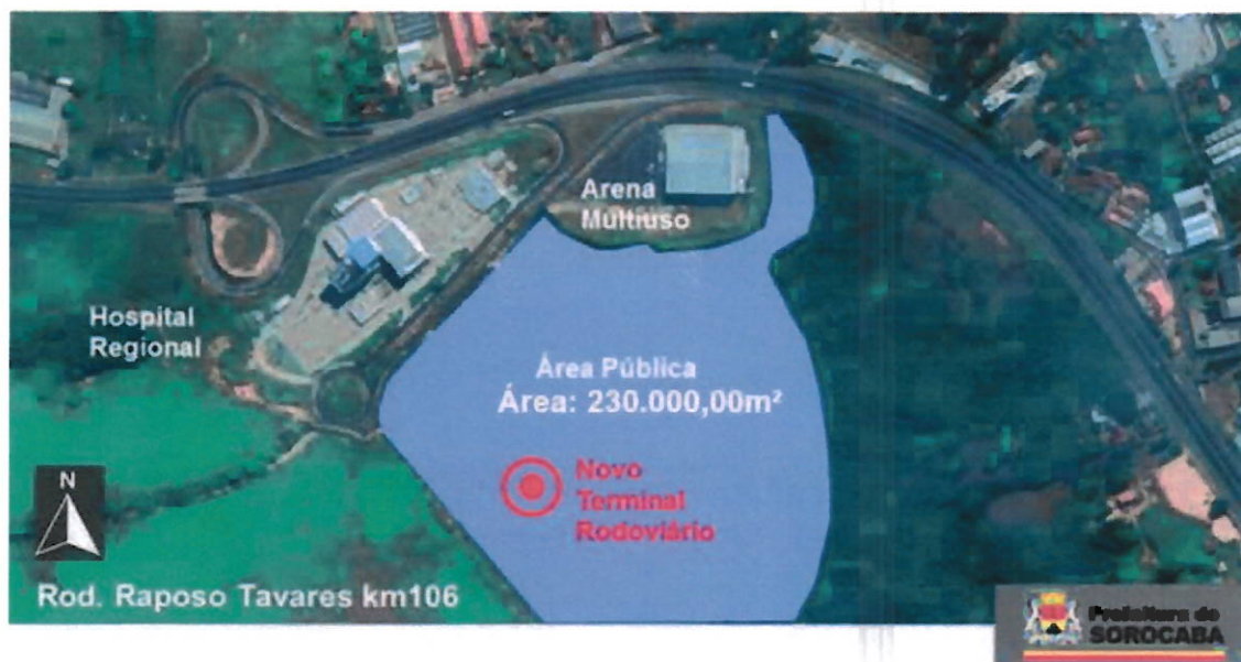
Imagem da área pública disponível